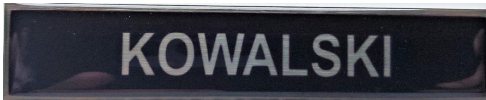
Fot. 1 - Oznaka identyfikacyjna z nazwiskiem do ubioru wieczorowego, galowego, wyjściowego i służbowego (przykładowy widok oznaki z przodu)