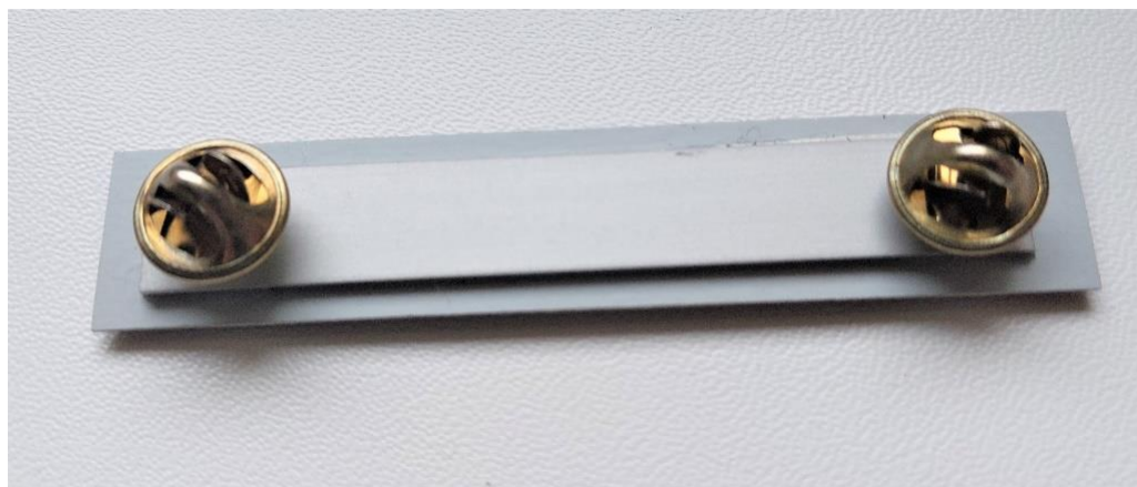
Fot. 2 – przykładowy widok zapięcia oznaki od spodniej strony